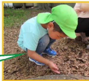
虫さん出ておいで～。