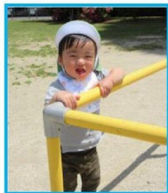
公園では砂場やすべり台、たくさん身体を動かして、汗をかきながらも楽しみみんなとてもいい笑顔です！