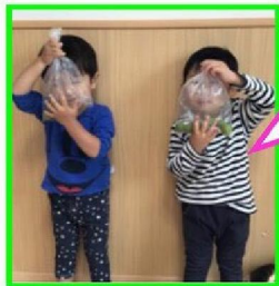
公園で梅の実たくさん拾ったよ！

晴れたり雨が降ったり、天気の変り変わりが多いこの時期。 子どもたちは室内や戸外に関係なく、汗ばみながら元気に遊んでいます！ 雨のジメジメも吹き飛ばし、体調管理に気を付けながら過ごしていきたいと思います。