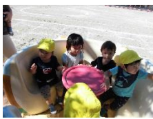
おざわ幼稚園訪問