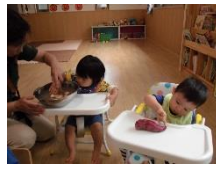
食貢（蒸かし芋作り）