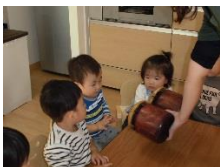
「これ、なあに？」 「ボンゴでーす☆」