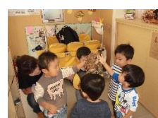
フクロウが来たよ！