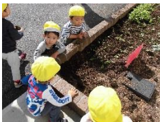
葉っぱ出てきたね！